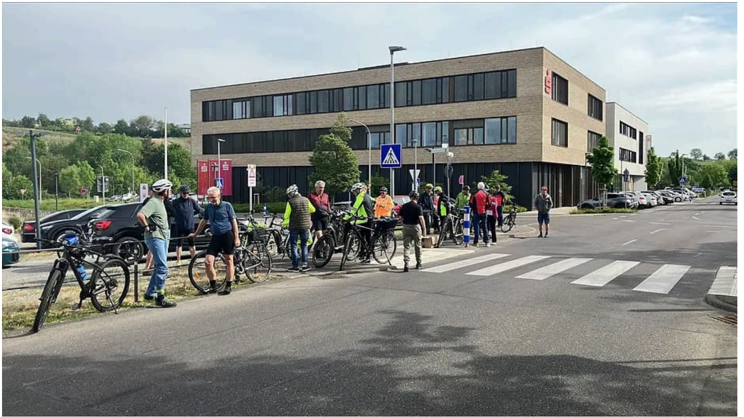
Kurz vor dem Start der Radtour machen sich die Radfahrer am Bahnhof in Lauffen bereit.