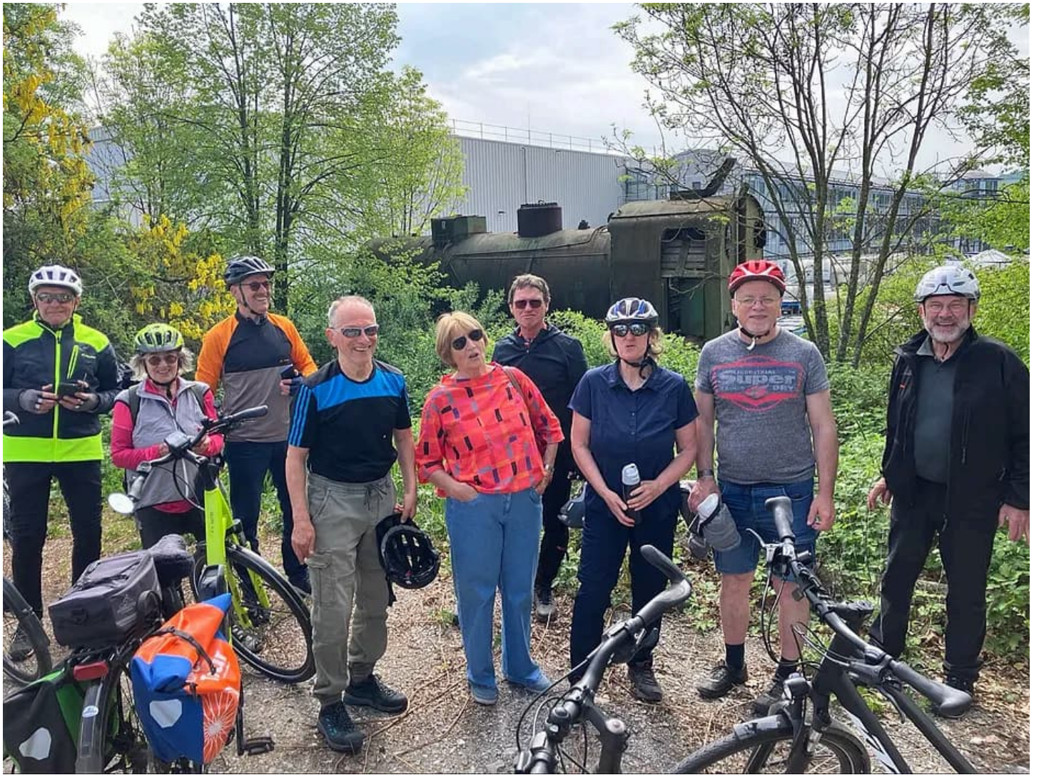
Die Radtour passiert einen ikonischen Ort der örtlichen Bahngeschichte. Bei Güglingen-Frauenzimmern steht eine alte Lok, vergessen im Gestrüpp.